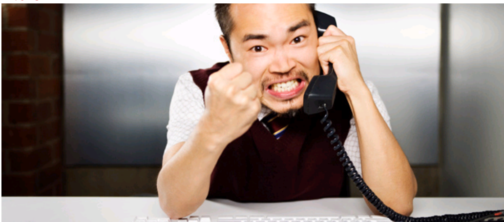
Pas toujours évident de résilier son abonnement